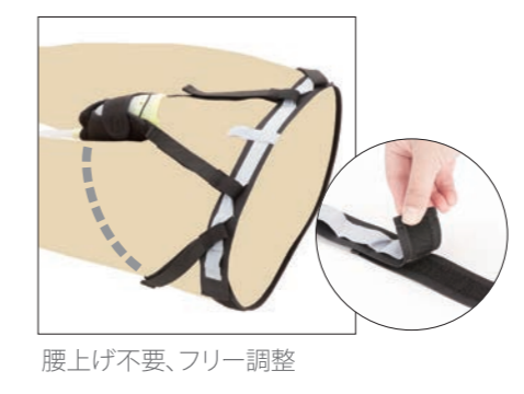
腰上げ不要、フリー調整